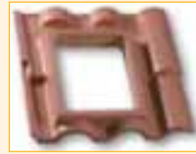
Versione CP per coperture in COPPO PORTOGHESE ®

Utilizzabile per canne fumarie fino ad una misura interna di cm 30 x 40.