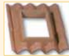
Versione DC per coperture in DOPPIO COPPO ® BREVETTATO