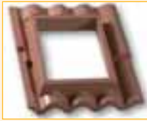
Versione CM per coperture in COPPO MEDITERRANEO ®