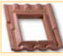
Versione DR per coperture in DOPPIA-ROMANA ®

Conversa regolabile in rame con bandella anteriore in piombo