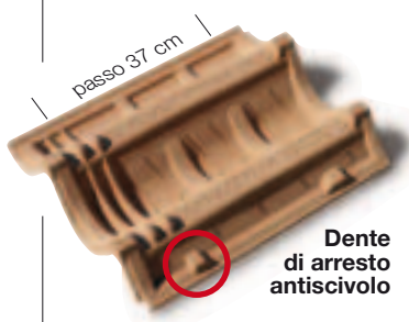
Dente di arresto antiscivolo

Il DoppioCoppo® è in grado di offrire l' effetto ombra tipico delle coperture tradizionali - grazie al design dell'esclusivo frontale ad effetto ombra - e di limitare notevolmente il numero di pezzi per metro quadrato ( solo 7,4 ).