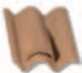
Tegola per aerazione