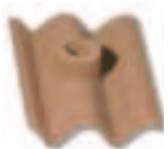
Tegola per antenna