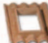
Base 4 tegole