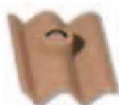
Tegola ancoraggio TV