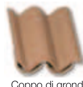
Coppo di gronda